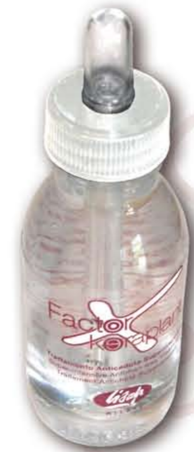
Flacone da 100 mL