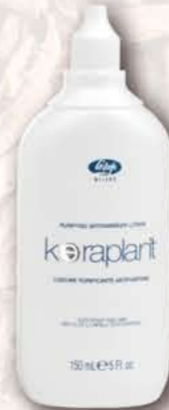
Fiacone 150 mL

PURIFYING ANTIDANDRUFF LOTION È un trattamento specifico. L'uso regolare elimina la forfora e lascia i capelli brillanti e soffici.