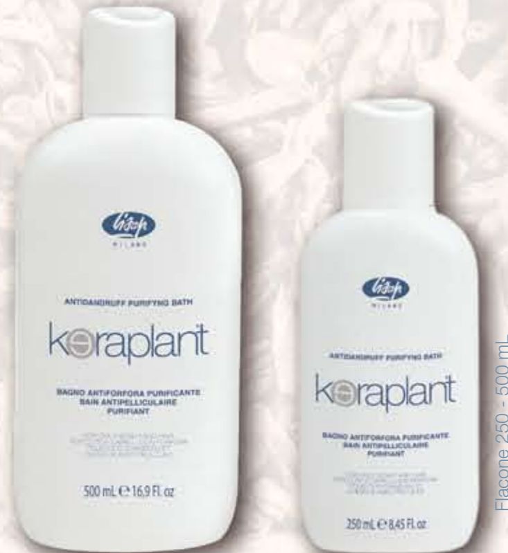
Fiacone 250 - 500 mL

ANTIDANDRUFF PURIFYING BATH è un bagno dolce specifico, elimina la forfora e ne rallenta la formazione.