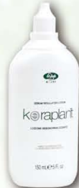
Fiacone 150 mL