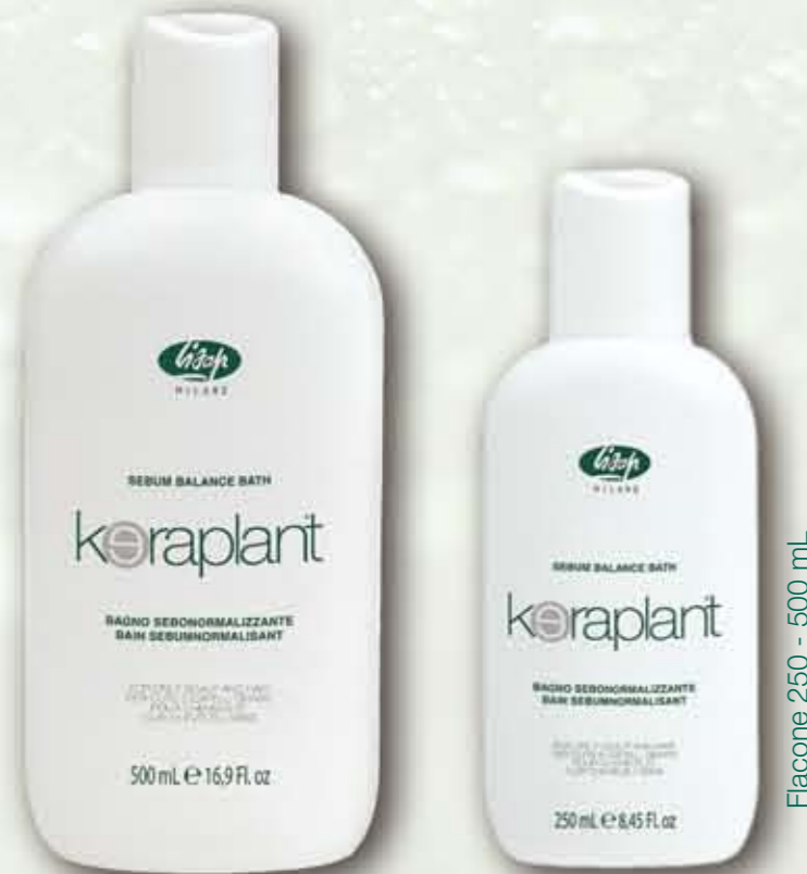
Fiacone 250 - 500 mL

E' ideale per un utilizzo regolare, per lavare efficacemente ma con estrema dolcezza, eliminando microrganismi, riequilibrando il cuoio capelluto ritardando la ricomparsa del sebo.