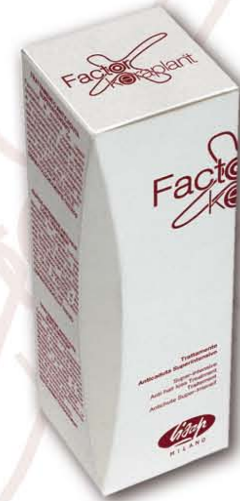
Astuccio 1 Flacone da 100 mL

Trattamento anticaduta superintensivo energizzante , agisce sul capello migliorandone le qualità estetiche, regola la secrezione sebacea, frena la caduta e stimola la ricrescita.