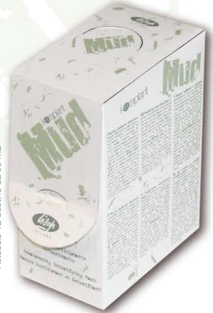
Astuccio 12 bustine da 50 mL