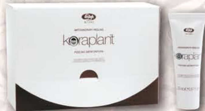
Astuccio 4 tubi da 20 mL

ANTIDANDRUFF PEELING è un lavante ad azione lenitiva ed intensiva, favorisce il distacco della forfora dal cuoio capelluto con azione purificante e calmante.